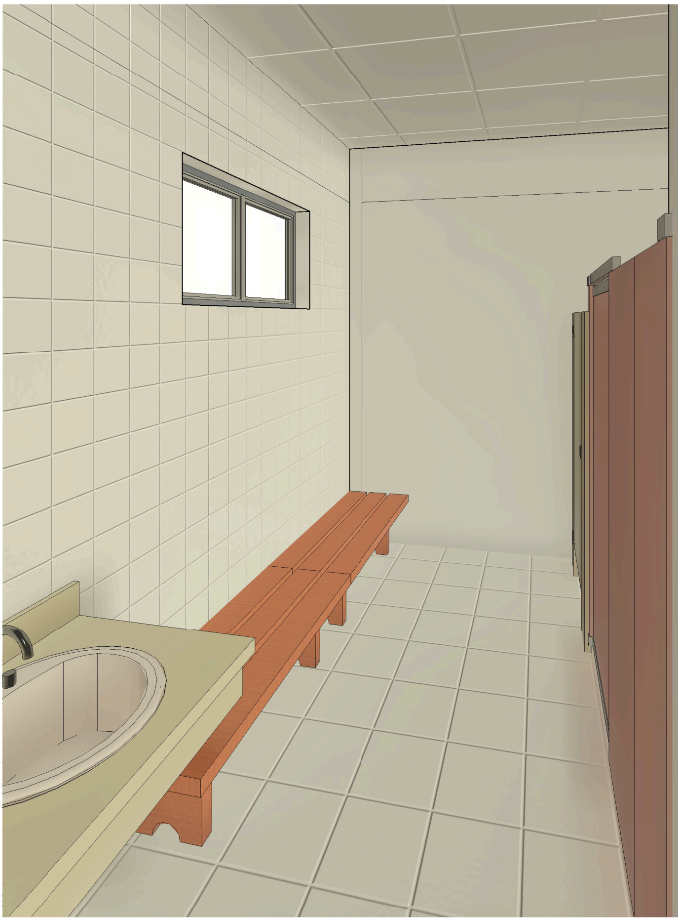
4 Vista 3D 1