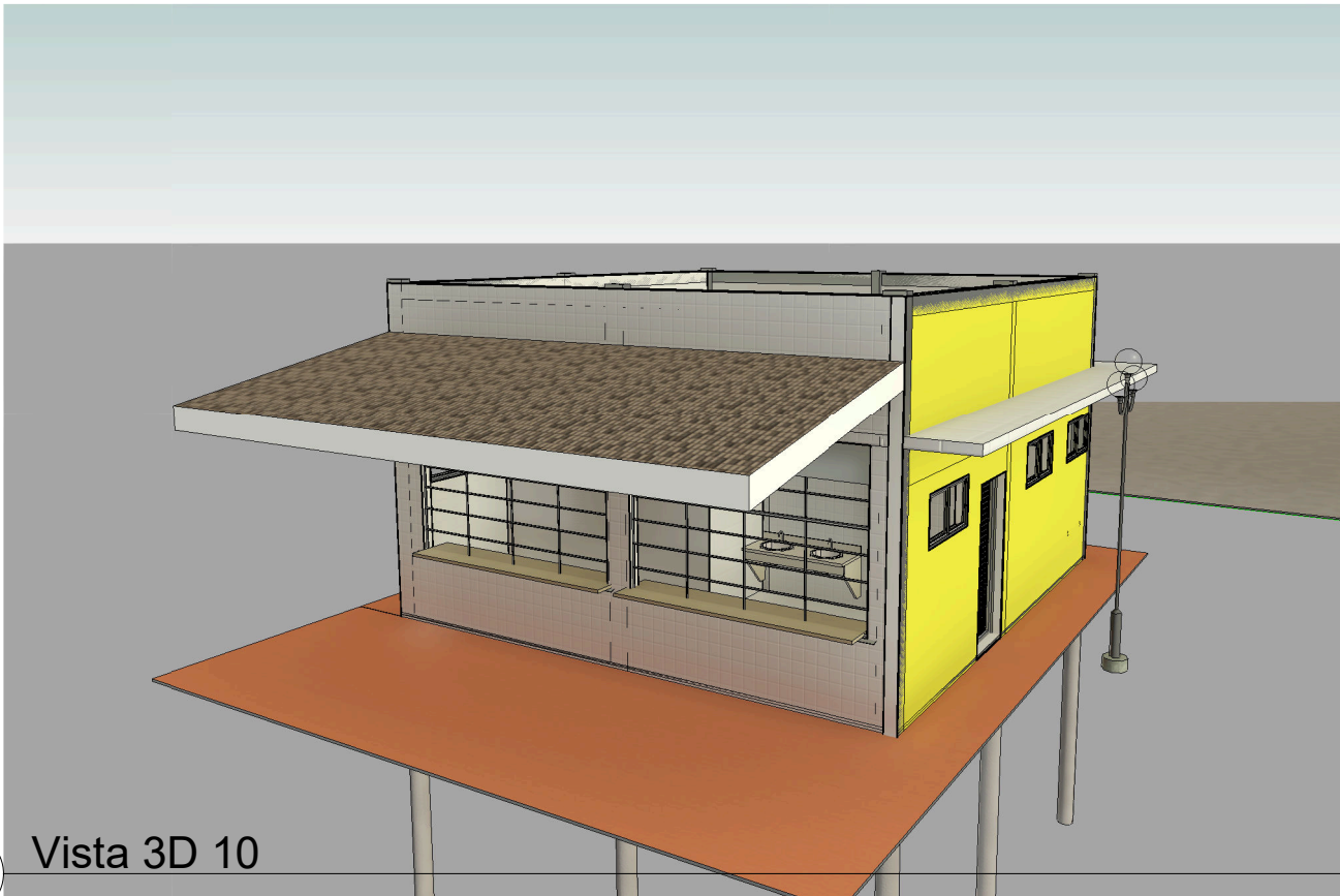
1 Vista 3D 10