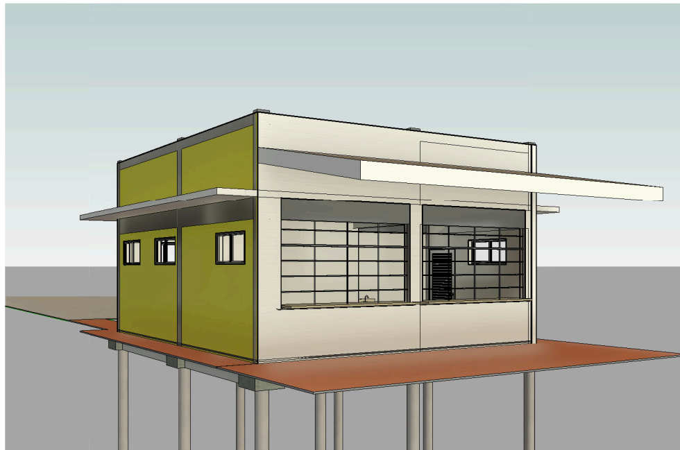
2 Vista 3D 11