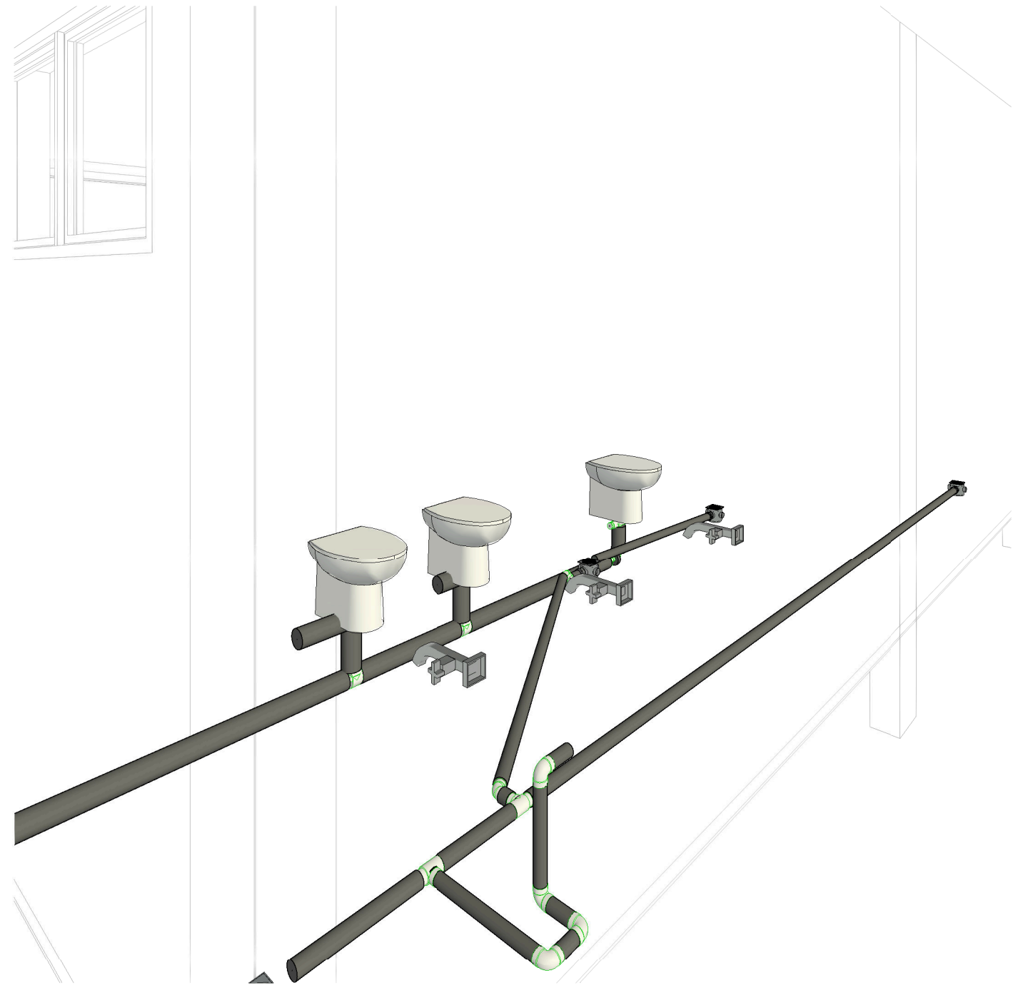
1 Vista 3D 1